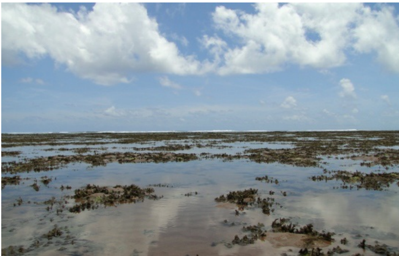
(algas de águas frias, ao alto, e algas em recifes costeiros, na Bahia, acima)

Portanto, daqui em diante, nada de pisar no tomate. Melhor mesmo é sapecar algas marinhas na lavoura e saborear produtos agrícolas mais saudáveis e nutritivos!