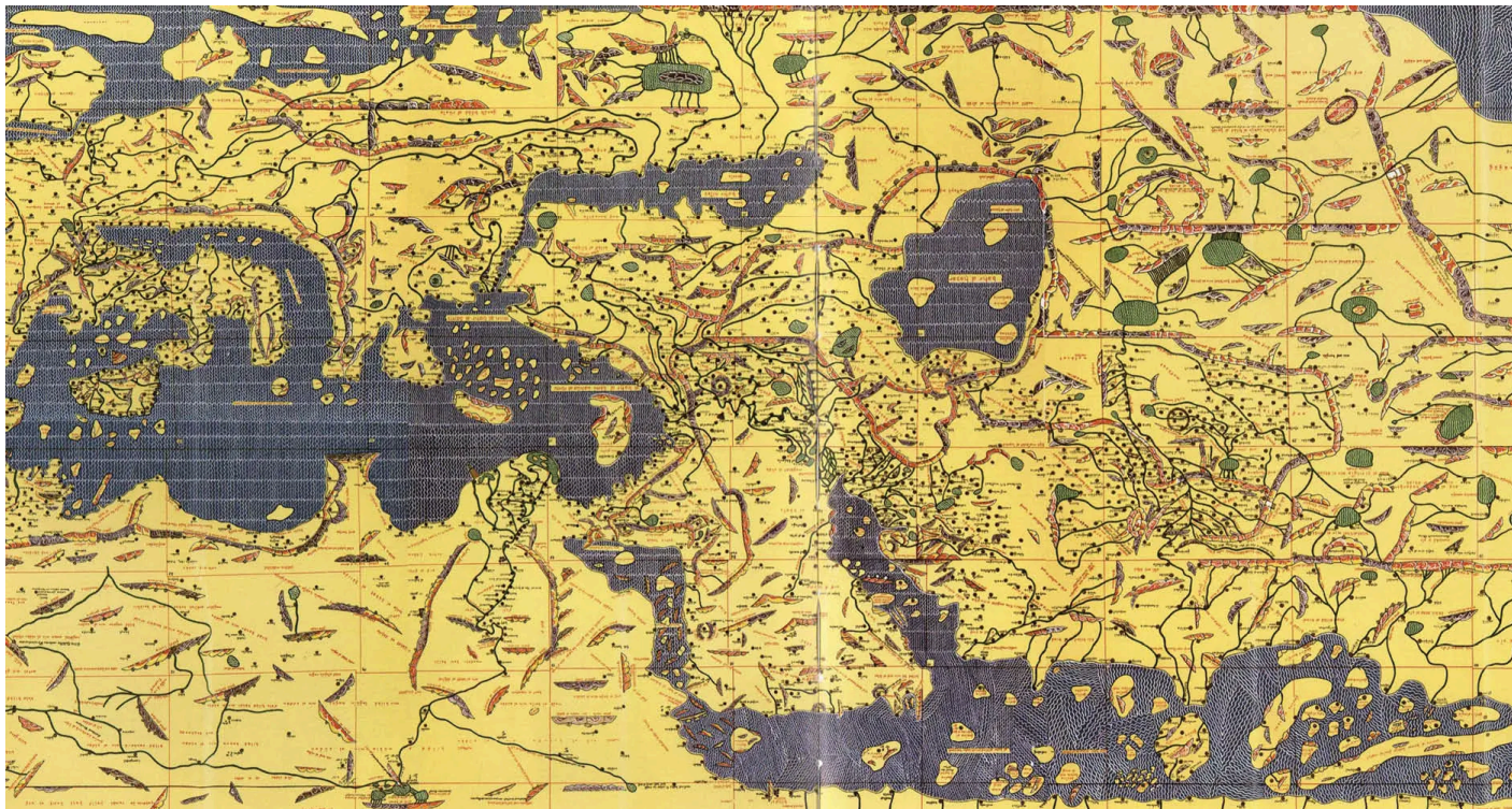
Mapa mostra a Península Arábica ao centro e destaca o Mar Mediterrâneo e o Mar Vermelho, que separam a Europa e a Ásia da África, respectivamente

Artigos > Edição 324 > O IBGE perdeu o norte?