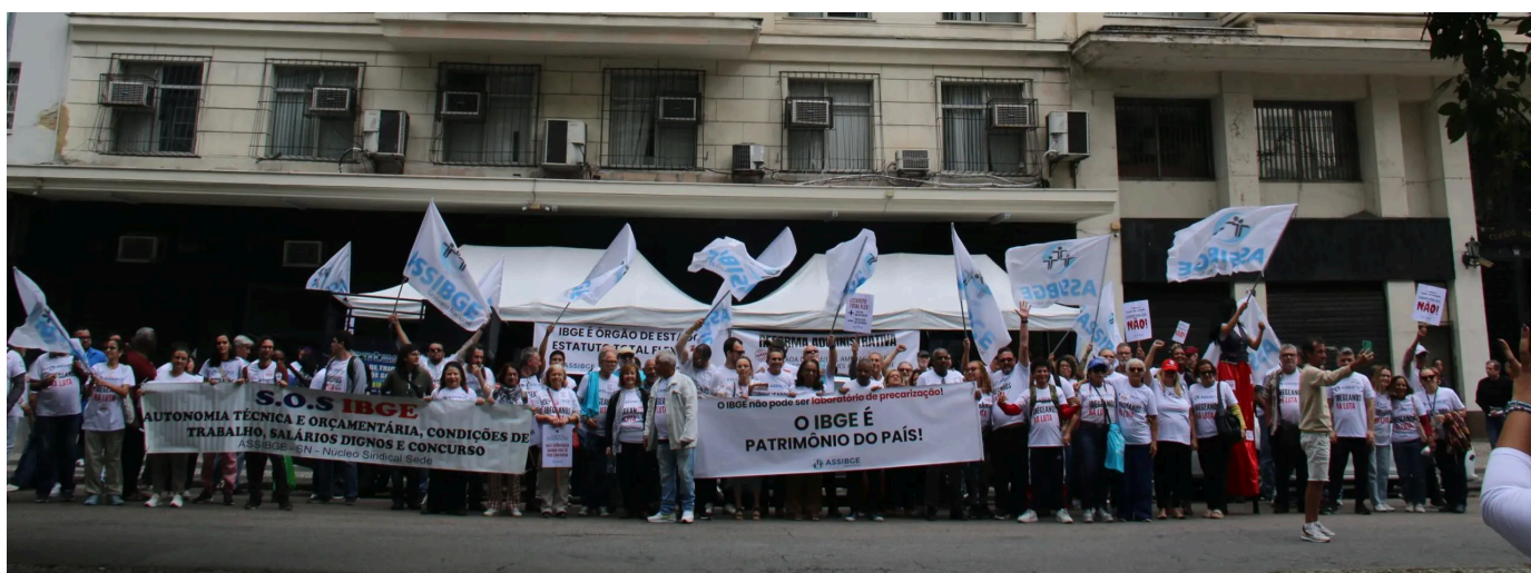
Mapa-múndi invertido, com o Brasil no centro. Técnicos e sindicato (Assibge) rejeitaram a peça

Em meio à crise administrativa e técnica, o IBGE ainda se expôs a controvérsias desnecessárias na cartografia. Divulgou um mapa-múndi invertido, com o Brasil no centro. Técnicos e sindicato ( Assibge ) rejeitaram a peça. Viram ali um afastamento das convenções cartográficas e um gesto promocional. O Atlas Geográfico Escolar também exigiu erratas. Houve falhas conceituais, incluindo confusão entre períodos geológicos e trocas de siglas de Estados. Nenhum desses episódios, sozinho, arruinaria a reputação do instituto. Somados, reforçam a percepção de descuido. Falta exatidão.