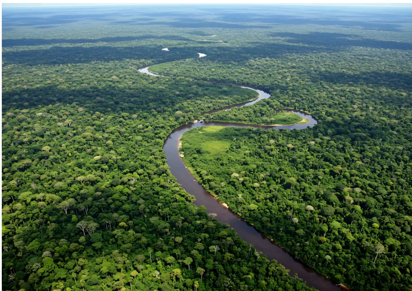
Vista aérea da floresta amazônica