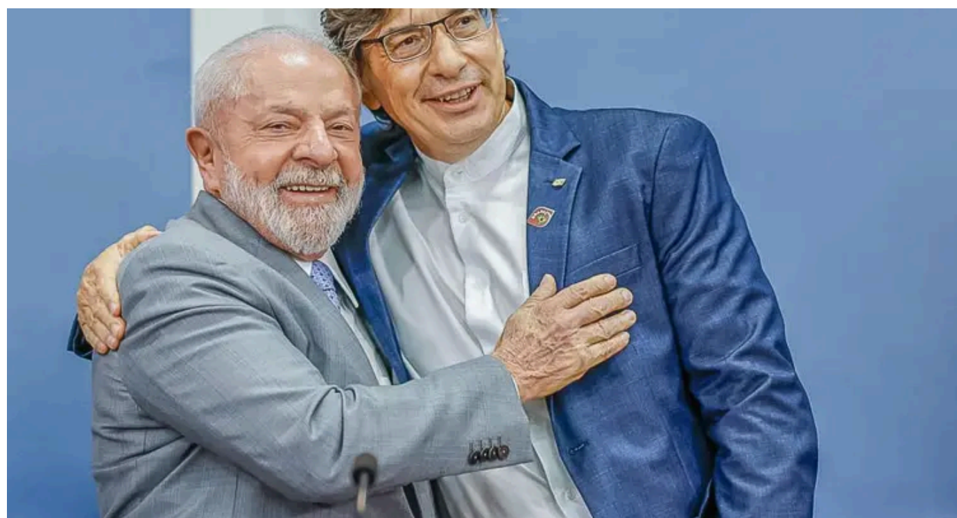
O presidente Lula ao lado do economista Márcio Pochmann, presidente do IBGE

Tomados em separado, são episódios de gestão. Reunidos, desenham um quadro grave. Exigem atenção pública. Está em jogo a credibilidade de uma instituição fundada na estabilidade, no rigor, na confiança.