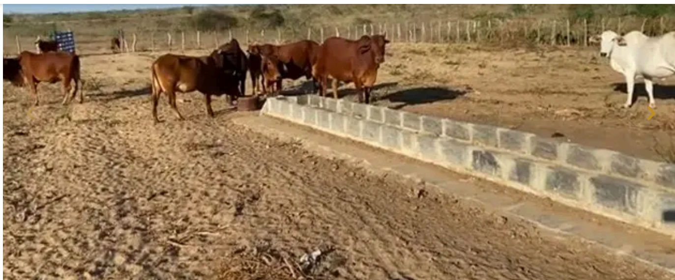
Pecuária na caatinga

Na genética, o uso de sêmen de raças adaptadas ao estresse térmico e de alto valor genético (Girolando, Nelore) e, na nutrição, a utilização de sais proteinados e técnicas de manejo de pastagens aceleram o ganho de peso. O melhoramento genético pode gerar um aumento de 15-30% em produtividade e 20-35% na renda familiar rural.