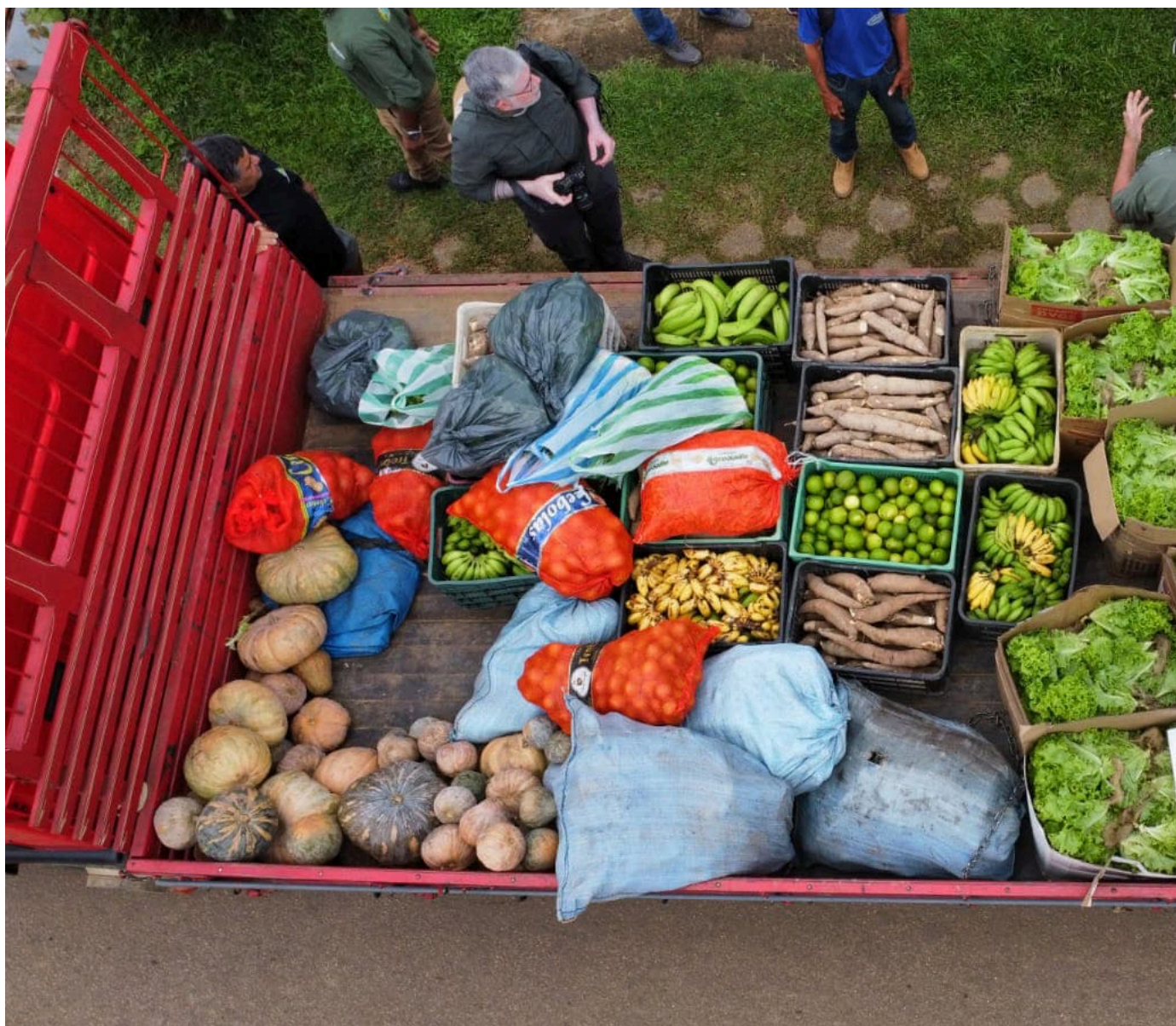
Alimentos produzidos por pequenos produtores rurais de Brasileia (AC).

COP30: Camponeses invisíveis, ameaçados de extinção – Desde o Neolítico, pratica-se agricultura na Amazônia. O cultivo da terra começou ali, com paleoíndios 1 . Dos agricultores brasileiros, quantos vivem na Amazônia? Quais seus maiores desafios sociais e econômicos? Quem defende seus interesses ou deseja seu desaparecimento? Esses produtores não se assemelham aos do resto do Brasil. Estão ausentes nos fóruns e temas da COP30, em Belém (PA). Sem direitos, eles são uma espécie ameaçada de extinção. E sem eles, a Amazônia passará ainda mais fome.