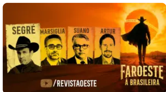
FAROESTE À BRASILEIRA