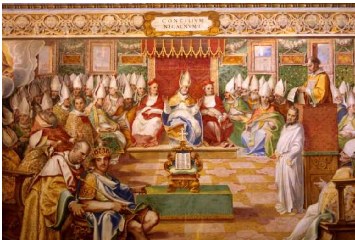
Primeiro Concílio de Niceia | Foto: Wikimedia Commons

Festa móvel, a Páscoa não está fixada no calendário civil, como o Natal ou o Dia da Independência. Pelas regras estabelecidas pela Igreja Católica no século 4, no Concílio Ecumênico de Niceia (325), celebra-se a Páscoa no domingo após a primeira lua cheia, depois do equinócio da primavera boreal.