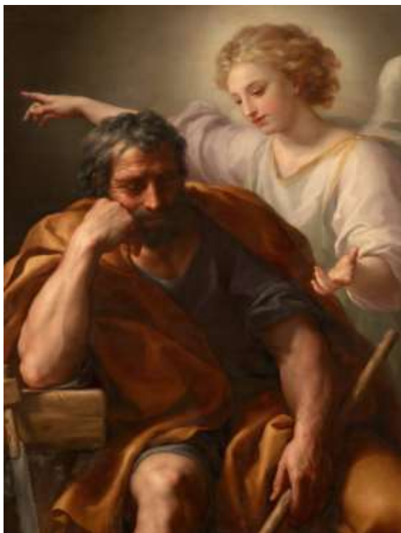
O Sonho de São José, pintura de Anton Raphael Mengs, feita em 1773-1774

O tempo do equinócio ilustra os atributos cósmicos de José, esposo de Maria: estabilidade, equilíbrio, comedimento, equidade e prudência, necessários ao Brasil, nos dias de hoje. Um dirigente estável age e busca a harmonia, como São José. É moderado nas maneiras, gestos, palavras e sentimentos, demonstra comedimento, sabe encontrar o meio-termo, possui estabilidade mental e emocional, autocontrole e autodomínio. O tempo do equinócio de outono e o dia do santo do equilíbrio, o carpinteiro José, vão bem juntos.