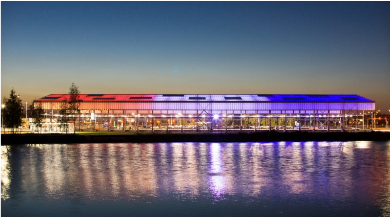
As cores do telhado são programadas por computador (Foto: Claessens Erdmann Architects & Designers)