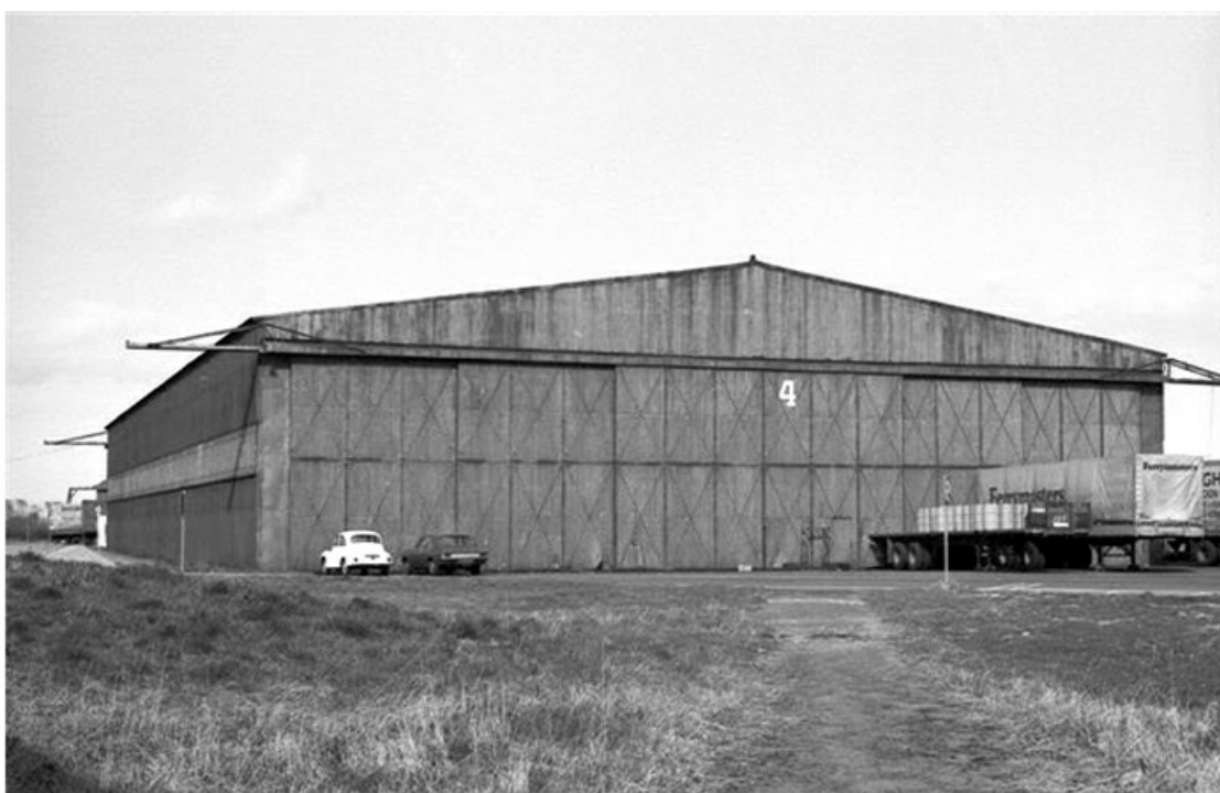
O velho hangar T2, como era nos anos 1940

O custo total da obra foi de 31 milhões de euros, metade dos quais saíram dos ministérios da Infraestrutura e do Meio Ambiente. Mais do que longos discursos sobre a necessidade de reaproveitar recursos naturais, a estação de ônibus Schiphol Norte é um testemunho eloquente de racionalidade, funcionalidade e eficiência no reúso de velhas estruturas .