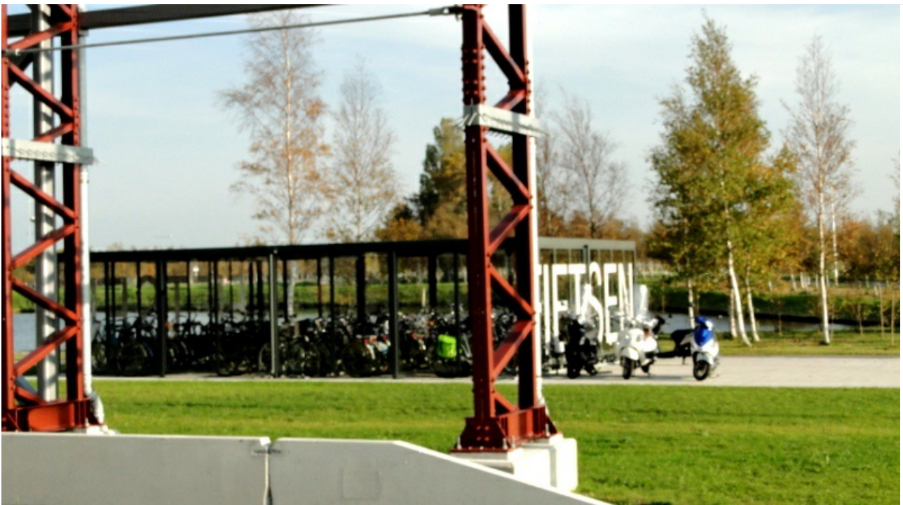
Um estacionamento coberto protege as bicicletas dos usuários