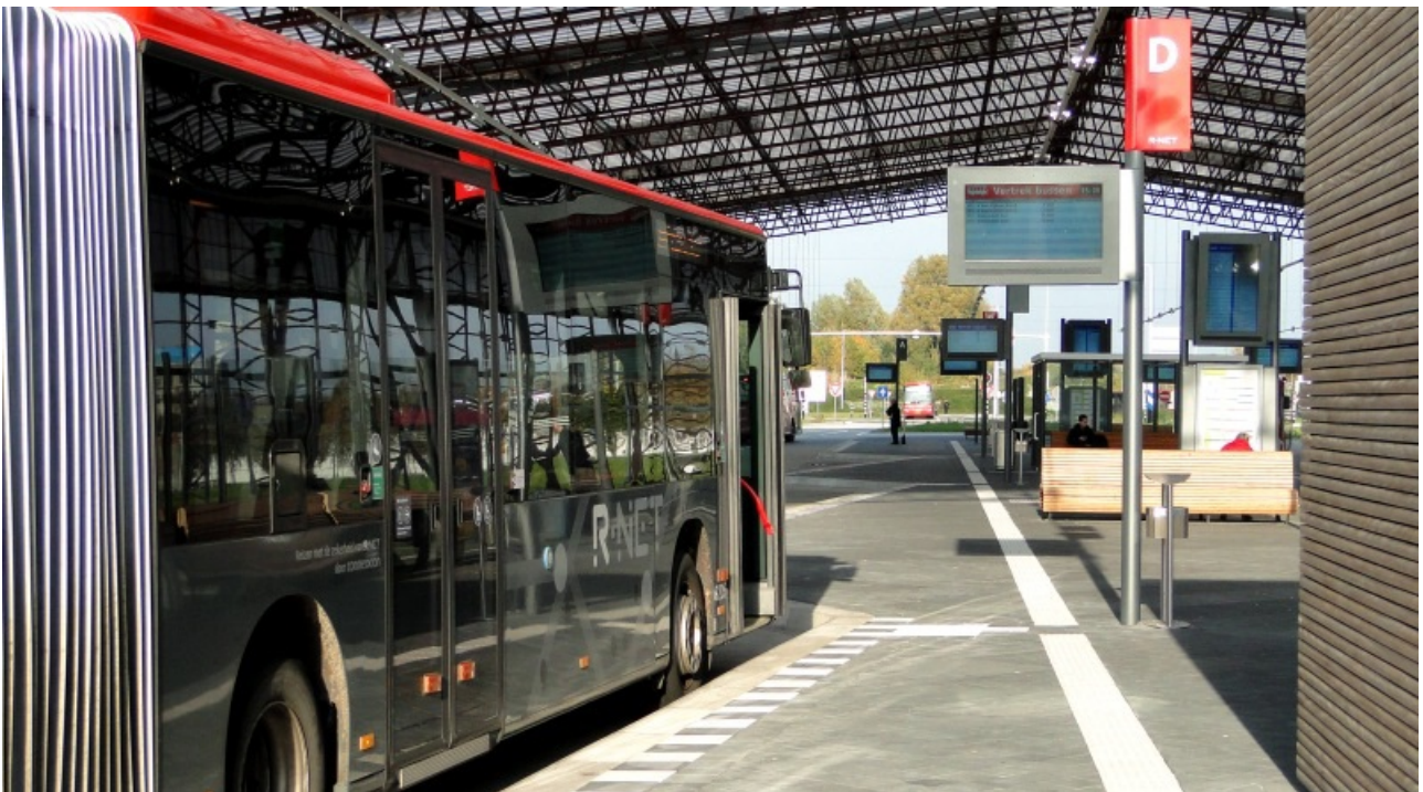
A estrutura original de 73 metros foi "esticada" para 100 metros. É o que se vê na foto de abertura e acima

Agora, assista ao vídeo que explica melhor como foi esse processo de reutilização da estrutura de aço que agora abriga os ônibus numa estação rodoviária. Em seguida, saiba mais detalhes deste especial sobre Economia Criativa.