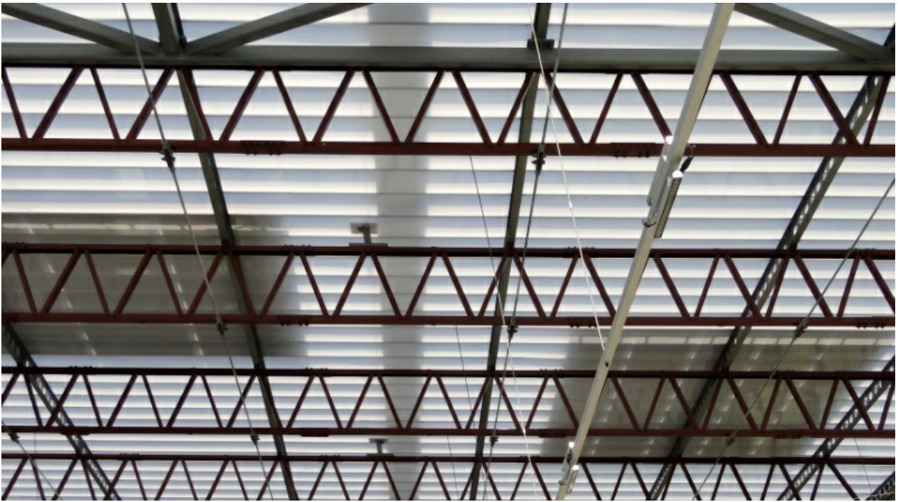
Reúso da velha estrutura de aço como estação de ônibus, em 2015