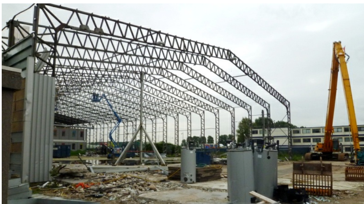
Reutilização do hangar T2 no aeroporto de Rotterdam, em 1968